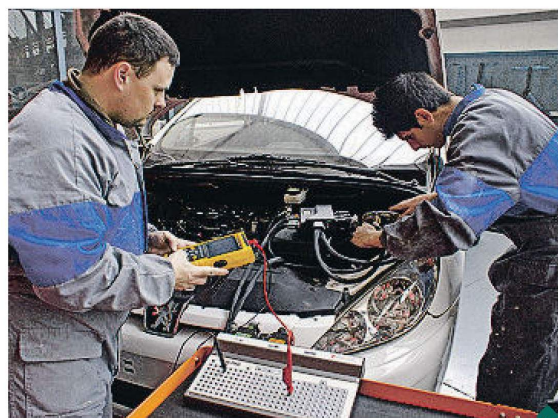
Alumnos del ciclo formativo de Automoción del Institut Pere Martell de Tarragona

La imagen que se tiene de la industria es aún muy tradicional y no refleja la realidad. Las familias y las personas con edad de construir su futuro